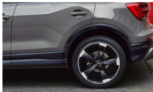
Jantes Audi Sport en aluminium coulé 19"