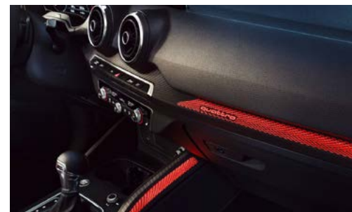
Pack éclairage d'ambiance