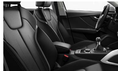
Sellerie cuir Milano noir avec surpiqûres gris roche. [Saisir le code intérieur YS]