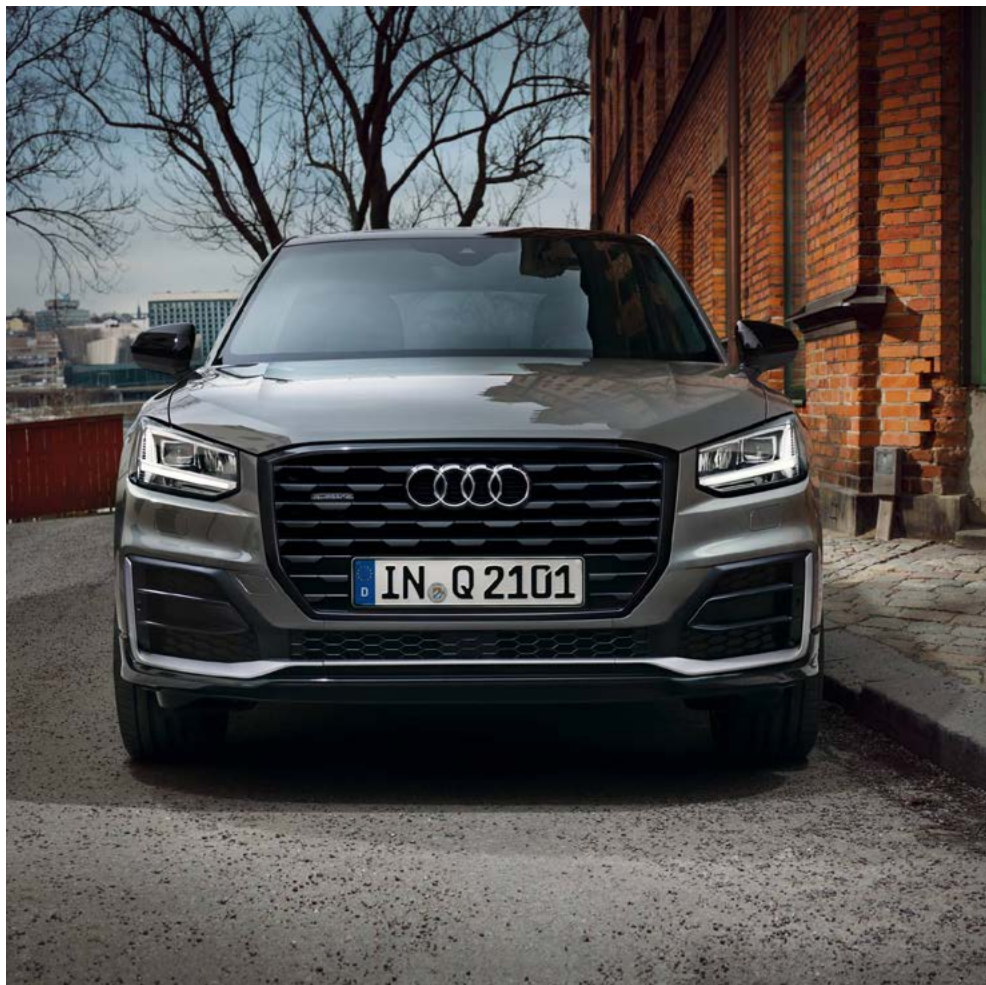
Pack extérieur S line exclusif de couleur contrastée gris Manhattan et rétroviseurs extérieurs de couleur contrastée noir brillant