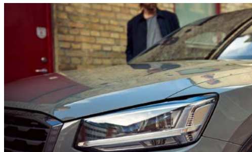
Phares à LED, avec clignotants arrière à LED dynamiques