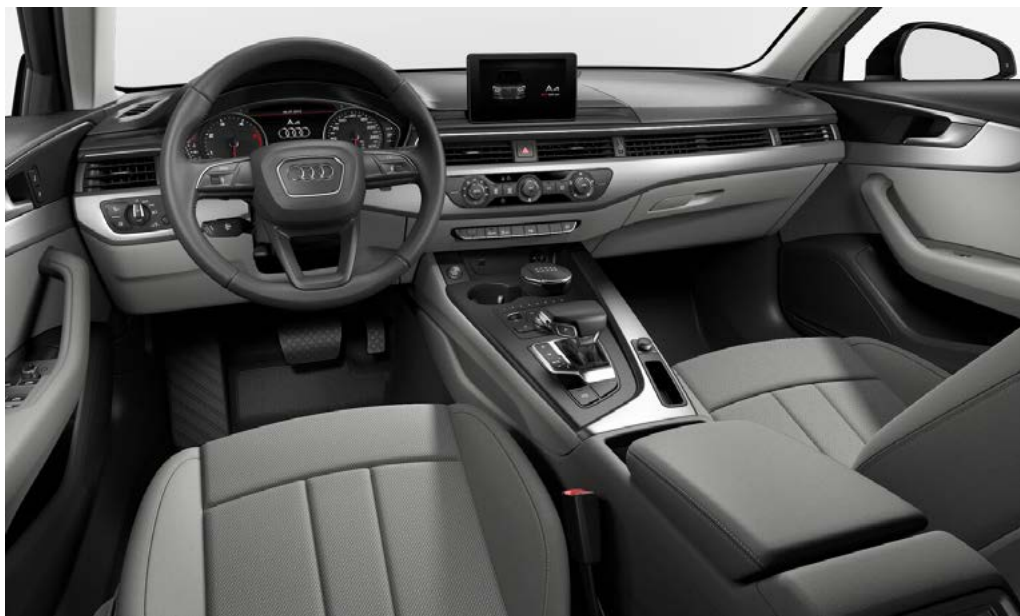
Intérieur Gris [ZG]