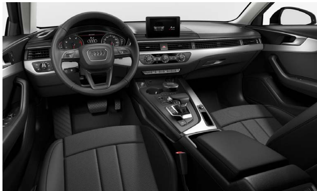
Intérieur Noir [YM]